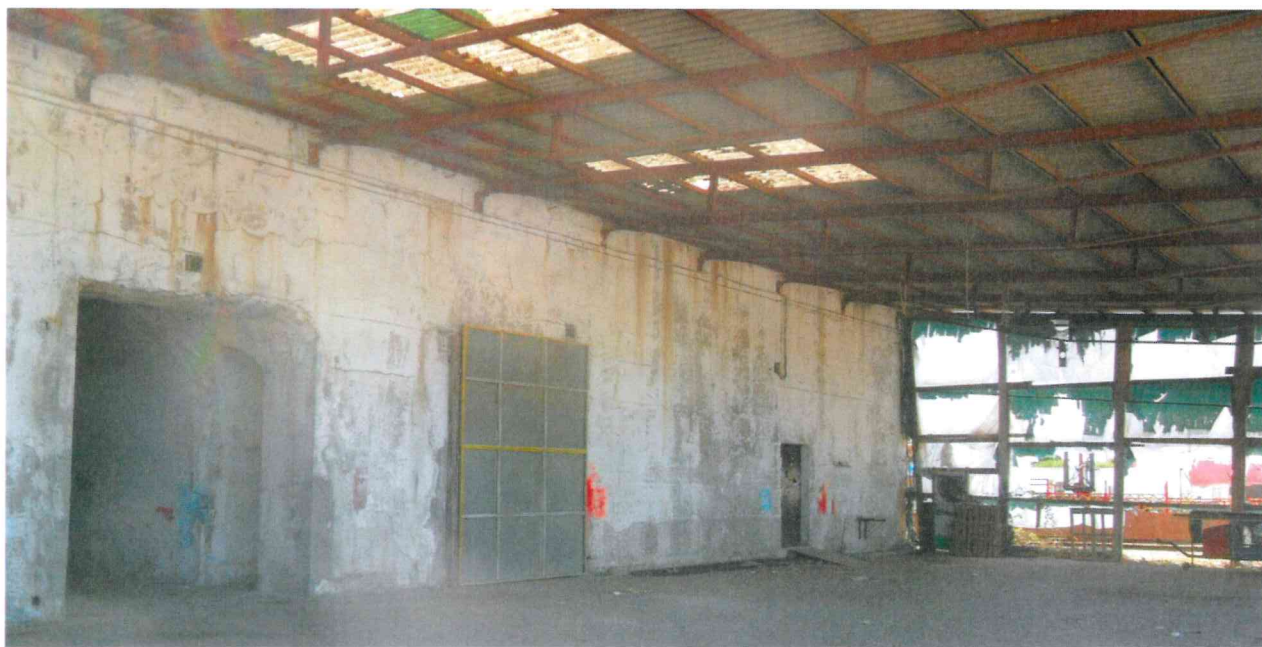
Prospetto principale dell'immobile