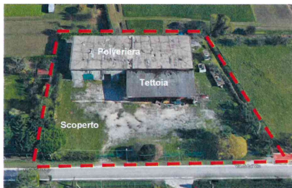
Area d'intervento con individuazione dei corpi di fabbrica