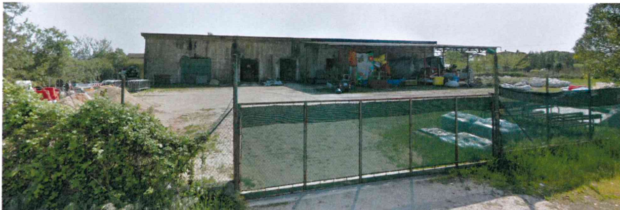
Prospetto principale dell'immobile

Il fabbricato (ex polveriera) è ante '42 e trattasi di edificio realizzato a scopo militare. La copertura è in cattivo stato di manutenzione. La tettoia adiacente, realizzata successivamente, è realizzata con struttura in acciaio e copertura in lastre di cemento-amianto. L'edificio è vincolato.